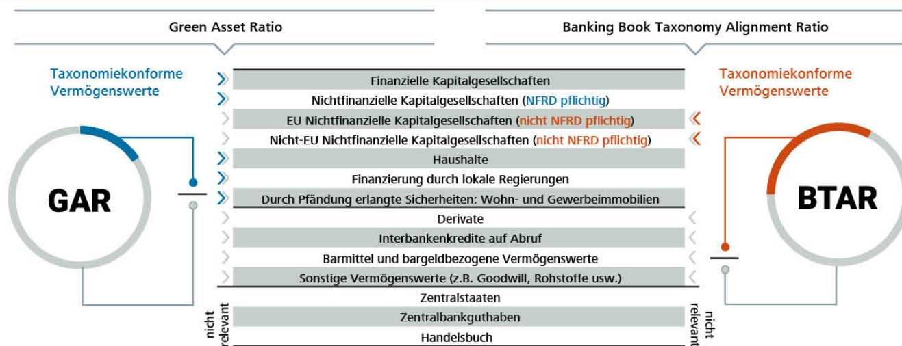
Abbildung 1: Relevanz von GAR und BTAR für Unternehmen der Realwirtschaft