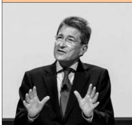
Bischof Prof. Dr. Dr. h.c. Wolfgang Huber

Im genossenschaftlichen Bausparen kommt das zum Ausdruck. So bündelt sich für mich das Thema des heutigen Tages – „Werteorientierung und genossenschaftliches Bausparen“ – in dieser Frage des Theologen und Märtyrers aus einer Schwäbisch Haller Familie: „Die letzte verantwortliche Frage ist nicht, wie ich mich heroisch aus der Affäre ziehe, sondern wie eine kommende Generation weiterleben soll.“ Sie ermutigt uns dazu, dass wir uns auch heute – in einer pluralistischen Zeit, in der nach der Auffassung vieler die Beliebigkeit herrscht – um ein klares Wertegerüst bemühen, aus Fehlern lernen und die Verantwortung für die Zukunft ins Zentrum rücken. Was kann das genossenschaftliche Bausparen dazu beitragen?